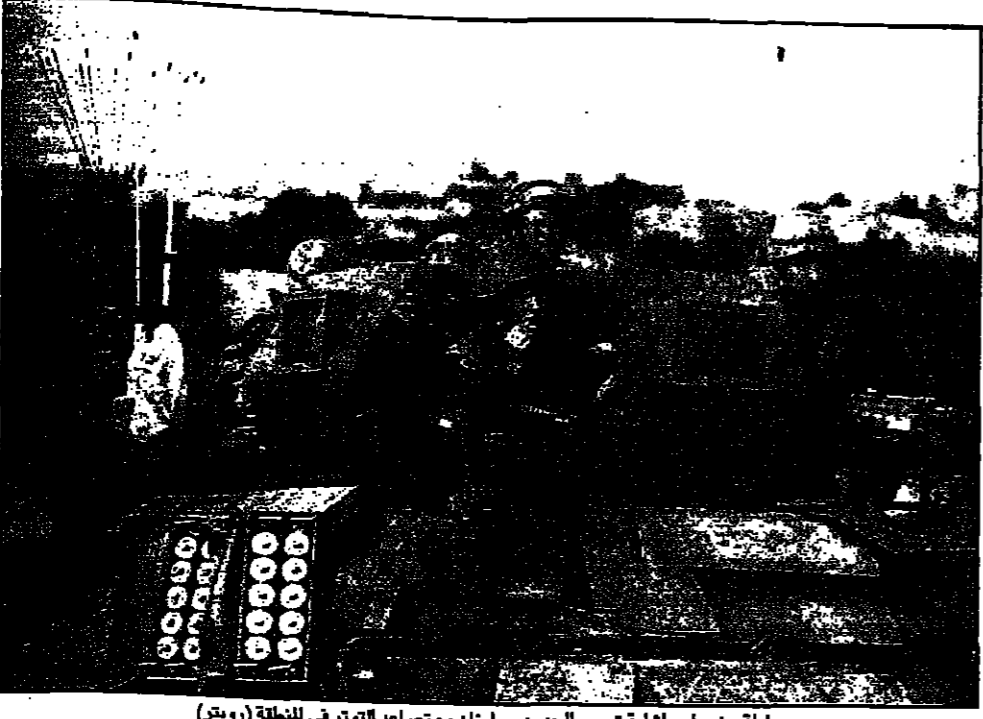
حلمة جنود اسرائيلية تجوب المرحوم مع لبنان عن تصاعد التوتر في المنطقة

القُدس - (صور لبنان) - بيروت - رويترز - قال الجيش الاسرائيلي ان مقر هذه التهديدات بحاجة الى وقف عملها، مشيرة الى ان الصراع قد أصبح ذا مدى اوسع، كما احتاج الى جهود اكثر تعقيدا، وأنه من الصعوبة بمكان ان تمكن دول الخليج من توفير بخرات تقنية وعلمية عالية للتوصل اليه. فيما قالت مصادر في وزارة الدفاع ان مسؤولين في الوزارة اعتدروا ان بريدها هي اكثر دول موزونين في العالم من الشرق الاوسط.